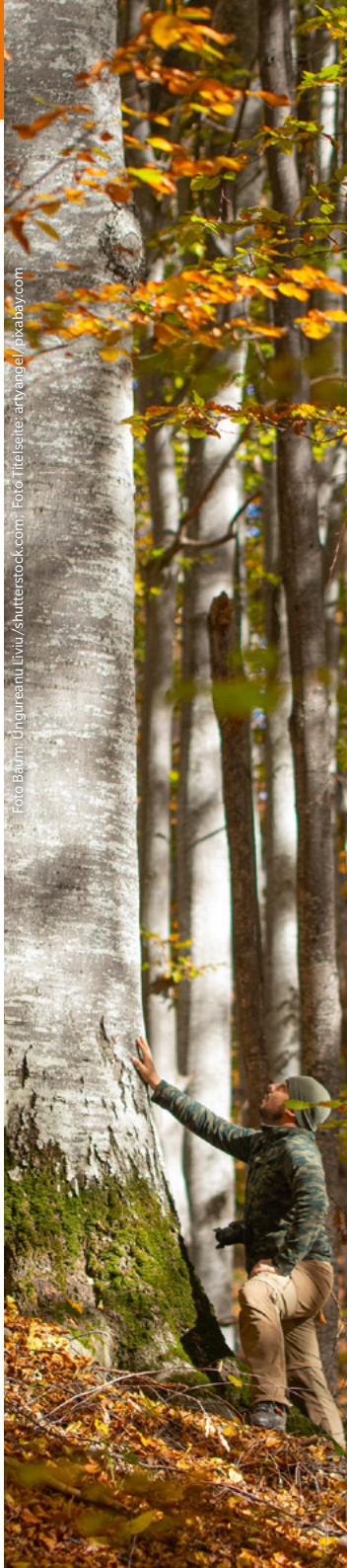
Foto: Baum: Ungureanu Liviu/Shutterstock.com; Foto: Fildes: aryanage/pxabay.com