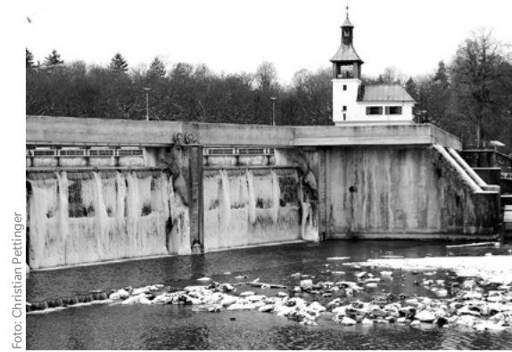
Der Augsburger Hochablass ist ein Wehr im Lech zur Wasserableitung ins System der Lechkanäle.

ge hin bisher noch nicht gegeben hat. Dann lässt sich erkennen, ob wir unsere Grundwasserquellen über das Maß der Regenerationsfähigkeit hinaus ausbeuten. In jedem Fall müssen wir höllisch aufpassen: Die Staatsregierung plant eine Wasser-Ringpipeline, in welche die Regionen mit hohem Wasservorrat einspeisen sollen, um die Regionen mit niedrigem Wasservorrat zu unterstützen. Das klingt erst mal nach einer solidarischen Aktion unter Nachbarn, aber erfahrungsgemäß stecken bei der Staatsregierung immer irgendwelche kommerziellen Interessen von Gewerbe und Industrie dahinter.