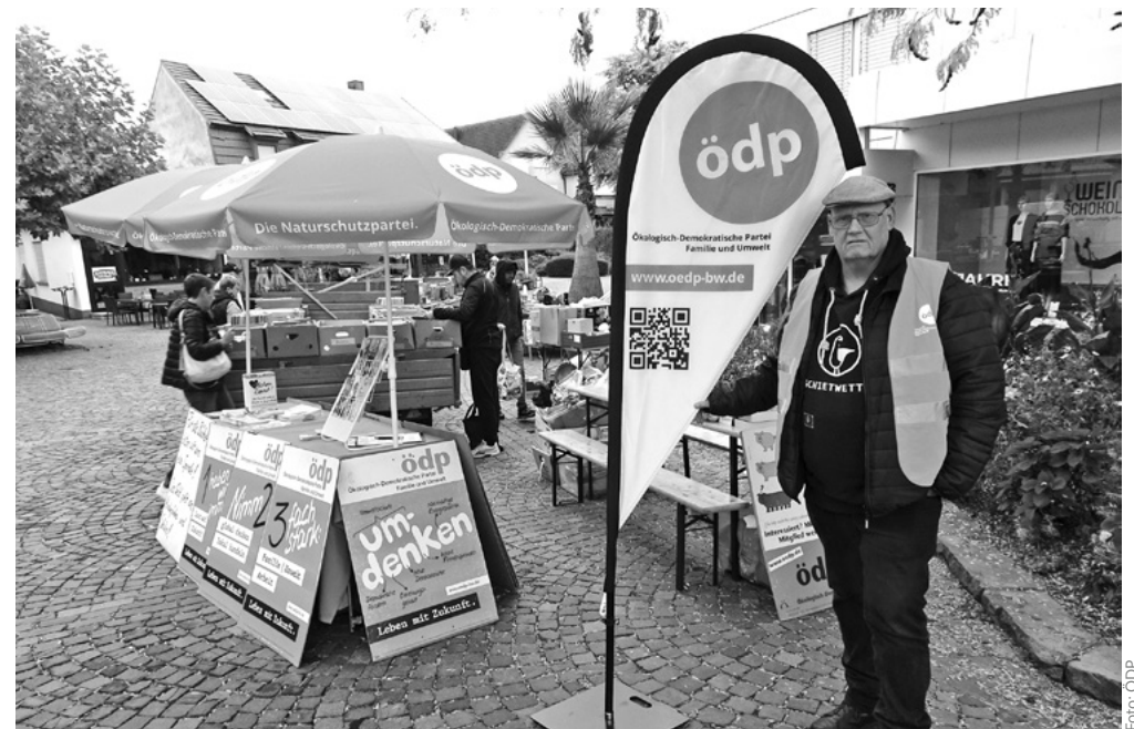
Der Kreisverband Heilbronn sammelte in Verbindung mit seinen beliebten Bücherflohmärkten Unterstützungsunterschriften.