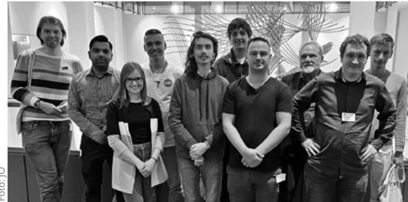
Die JÖ-Gruppe mit dem ÖDP-Bundesvorsitzenden Günther Brendle-Behnisch (3. von rechts) im Paul-Henri-Spaak-Gebäude des EU-Parlaments in Brüssel

Vom 12. bis 14. November 2025 reiste eine Gruppe der JÖ – jung. ökologisch nach Brüssel, um das Europäische Parlament zu besuchen und die ÖDP-Europaabgeordnete Manuela Ripa zu treffen.