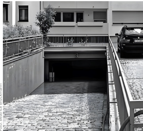
Überschwemmte Tiefgarage nach Starkregen

In der Folge formierten sich parteiübergreifend engagierte Bürgerinnen und Bürger, die sich gegen die weitere Bebauung in unmittelbarer Nähe ihrer bereits über-