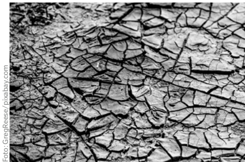
Lange Trockenperioden lassen kleine Bäche und Tümpel austrocknen – und den Grundwasserpegel sinken.

Mittelfristig in den Wassernotstand. Um es aber auch klar zu sagen: Niemand muss in Deutschland Angst haben, beim nächsten oder übernächsten Hitzesommer zu verdursteten. Aber es ist auch klar: Wenn der Verbrauch steigt, die Vorräte schrumpfen und Grund-