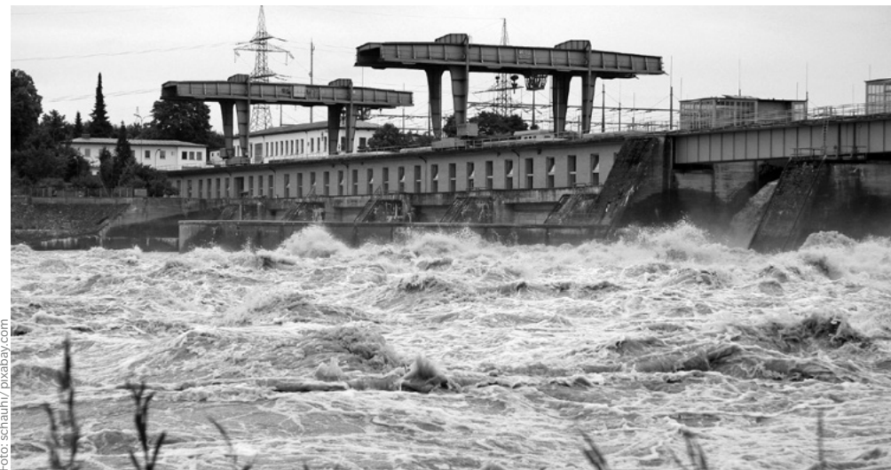
Starkregen fließt als Hochwasser schnell ab und trägt kaum etwas zur Regeneration des Grundwassers bei.