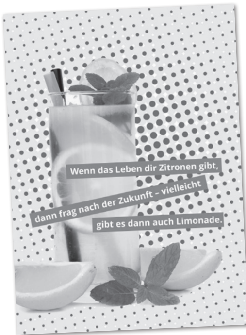
Postkarte: ÖDP Baden-Württemberg